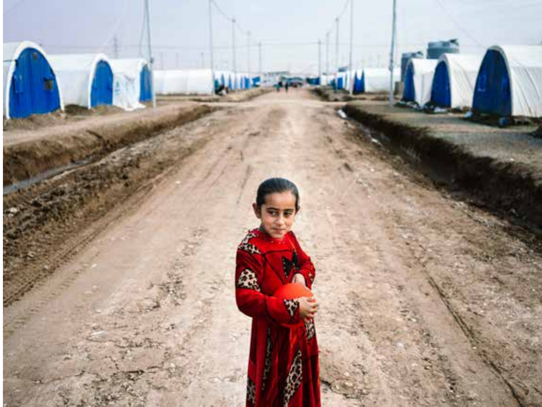
Fille irakienne qui a fui l'État islamique et qui se trouve maintenant dans le camp de réfugiés de Khazer

La paix et la sécurité ainsi que les défis auxquels sont confrontés les pays fragiles et en situation de conflit jouent un rôle central dans la réalisation des objectifs de développement durable. Cela vaut avant tout pour l'objectif 16 (paix, justice et institutions efficaces) qui sera placé au cœur de l'engagement danois. En outre, nous privilégierons au sein et aux alentours des pays et régions fragiles l'objectif 1 (pas de pauvreté), l'objectif 2 (faim « zéro ») et l'objectif 8 (travail décent et croissance économique). Nous contribuerons également à promouvoir d'autres objectifs, notamment dans le domaine social, comme l'objectif 4 (éducation de qualité) et l'objectif 5 (égalité entre les sexes), via nos actions multilatérales et la coopération avec la société civile.